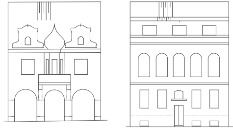
FAS. PŘEDNÍ /SEVER/